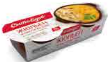
ЖЮЛЬЕН «КЛАССИЧЕСКИЙ» из курицы с грибами

вес изделия ..... 250 г в гофрокоробе ..... 12 шт. вид упаковки..... кокотница, обечайка