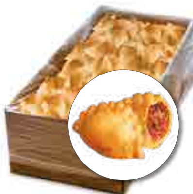
ПЕЛЬМЕШКИ ЖАРЕННЫЕ, СВЧ • с курицей и говядиной • с говядиной и свиной*