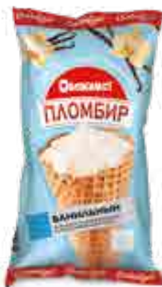
МОРОЖЕНОЕ ПЛОМБИР ВАНИЛЬНЫЙ В САХАРНОМ ВАФЕЛЬНОМ РОЖКЕ

вес изделия нетто ..... 70 г в гофрокоробе ..... 30 шт. вид упаковки..... пленка