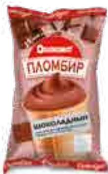
МОРОЖЕНОЕ ПЛОМБИР ШОКОЛАДНЫЙ В ВАФЕЛЬНОМ СТАКАНЧИКЕ

вес изделия нетто ..... 70 г в гофрокоробе ..... 30 шт. вид упаковки..... пленка