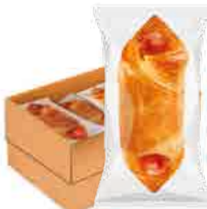
СОСИСКА В ДРОЖЖЕВОМ СЛОЕНОМ ТЕСТЕ, СВЧ

вес изделия ..... 120 г в гофрокоробе .. 40 шт.