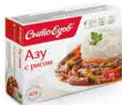
АЗУ с рисом

вес изделия ..... 350 г в гофрокоробе ..... 10 шт. вид упаковки..... контейнер, бандероль