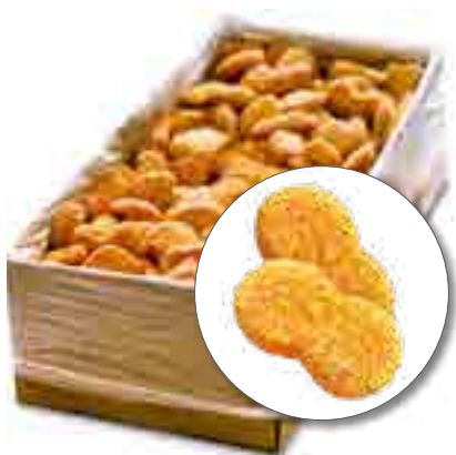
НАГГЕТСЫ КУРИНЫЕ СВЧ