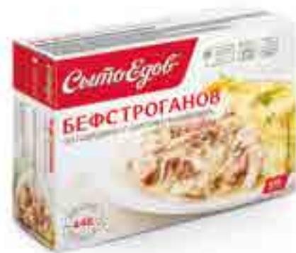
БЕФСТРОГАНОВ из говядины с картофельным пюре

вес изделия ..... 350 г в гофрокоробе ..... 10 шт. вид упаковки..... контейнер, бандероль