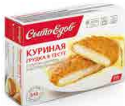
КУРИНАЯ ГРУДКА в тесте с соусом «Сюпрем» и картофельным пюре

вес изделия ..... 350 г в гофрокоробе ..... 10 шт. вид упаковки..... контейнер, бандероль