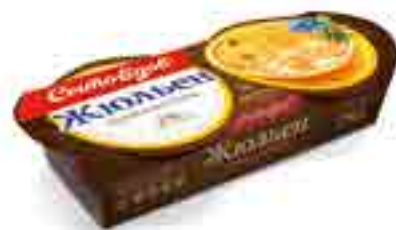
ЖЮЛЬЕН из мяса цыпленка

вес изделия ..... 250 г в гофрокоробе ..... 12 шт. вид упаковки..... кокотница, обечайка