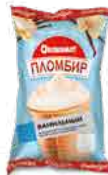
МОРОЖЕНОЕ ПЛОМБИР ВАНИЛЬНЫЙ В ВАФЕЛЬНОМ СТАКАНЧИКЕ

вес изделия нетто ..... 70 г в гофрокоробе ..... 30 шт. вид упаковки..... пленка