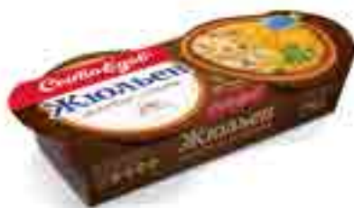
ЖЮЛЬЕН из курицы с грибами

вес изделия ..... 250 г в гофрокоробе ..... 12 шт. вид упаковки..... кокотница, обечайка