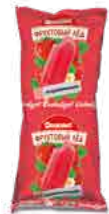
ФРУКТОВЫЙ ЛЁД С АРОМАТОМ КЛУБНИКИ

вес изделия нетто ..... 100 г в гофрокоробе ..... 20 шт. вид упаковки..... пленка