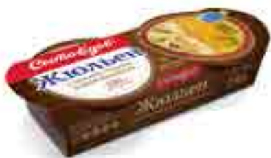
ЖЮЛЬЕН с белыми грибами и шампиньонами

вес изделия ..... 250 г в гофрокоробе ..... 12 шт. вид упаковки..... кокотница, обечайка