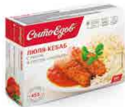
ЛЮЛЯ-КЕБАБ (с бараниной и говядиной) с рисом и соусом «Ткемали»

вес изделия ..... 320 г в гофрокоробе ..... 10 шт. вид упаковки..... контейнер, бандероль