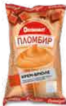
МОРОЖЕНОЕ ПЛОМБИР КРЕМ-БРЮЛЕ В ВАФЕЛЬНОМ СТАКАНЧИКЕ

вес изделия нетто ..... 70 г в гофрокоробе ..... 30 шт. вид упаковки..... пленка