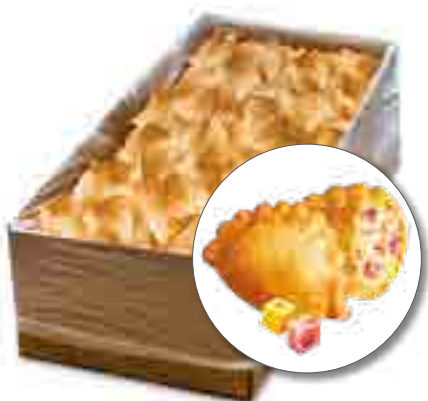
ХОТПИКСЫ, СВЧ (пельмешки жареные) с ветчиной и сыром