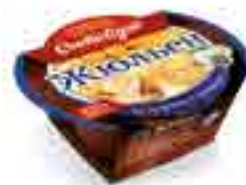
ЖЮЛЬЕН из курицы с грибами

вес изделия ..... 125 г в гофрокоробе ..... 12 шт. вид упаковки..... кокотница, обечайка