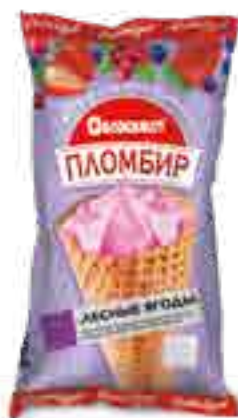
МОРОЖЕНОЕ ПЛОМБИР С АРОМАТОМ ЛЕСНОЙ ЯГОДЫ ВАФЕЛЬНОМ РОЖКЕ

вес изделия нетто ..... 100 г в гофрокоробе ..... 20 шт. вид упаковки..... пленка