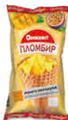
МОРОЖЕНОЕ ПЛОМБИР С АРОМАТОМ МАНГО-МАРАКУЙЯ ВАФЕЛЬНОМ РОЖКЕ

вес изделия нетто ..... 100 г в гофрокоробе ..... 20 шт. вид упаковки..... пленка