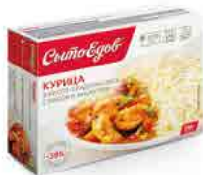
КУРИЦА в кисло-сладком соусе с рисом и кунжутом

вес изделия ..... 350 г в гофрокоробе ..... 10 шт. вид упаковки..... контейнер, бандероль