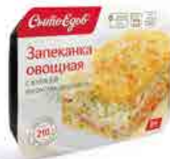
ЗАПЕКАНКА ОВОЩНАЯ с курицей и соусом «Бешамель»

вес изделия ..... 300 / 350 г в гофрокоробе ..... 10 шт. вид упаковки..... контейнер, бандероль