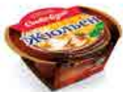
ЖЮЛЬЕН с белыми грибами и шампиньонами

вес изделия нетто ..... 250 г в гофрокоробе ..... 12 шт. вид упаковки..... кокотница, обечайка